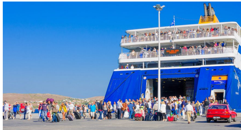
Πλοίο στο λιμάνι

Αρκετοί πλέον επιλέγουν να ταξιδέψουν με πλοίο. Η άνεση, οι παροχές, και οι ευκολίες, είναι μερικά από τα σημαντικά υπέρ του ακτοπλοϊκού ταξιδιού, ειδικά όταν υπάρχουν φθηνά εισιτήρια για όλα τα λιμάνια της Ελλάδας και του εξωτερικού. Κάποιους από τους λόγους που οι ταξιδιώτες επιλέγουν να ταξιδέψουν με πλοίο είναι επειδή μπορούν να πάρουν μαζί τους το μεταφορικό τους μέσο (αυτοκίνητο, μηχανάκι, ποδήλατο) καθώς το πλοίο δίνει τη δυνατότητα μεταφοράς τους. Μπορούν επίσης να πάρουν όσες αποσκευές θέλουν. Στο αεροπλάνο υπάρχει χρέωση για το επιπλέον βάρος ενώ στο αυτοκίνητο τίθεται θέμα χώρου στο πορτ μπαγκάζ. Το ταξίδι είναι πιο εύκολο καθώς το μόνο που αρκεί είναι ο κάθε ταξιδιώτης να βρίσκεται στο λιμάνι τουλάχιστον μία ώρα πριν την αναχώρηση, και να έχει το εισιτήριο μαζί του. Το νυχτερινό ταξίδι με πλοίο μπορεί σε ορισμένες περιπτώσεις να είναι η καλύτερη δυνατή επιλογή, ιδιαίτερα κάπου στη Μεσόγειο ή τη Σκανδιναβία.