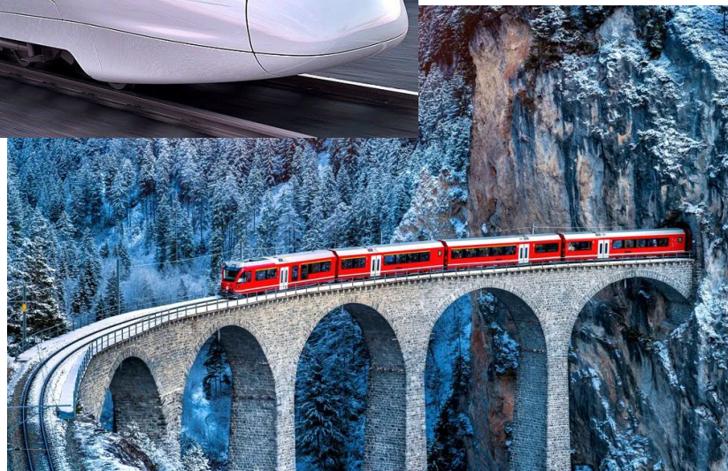
Τρένο "Bernina Express" πάνω σε πέτρινη γέφυρα στις Άλπεις της Ελβετίας