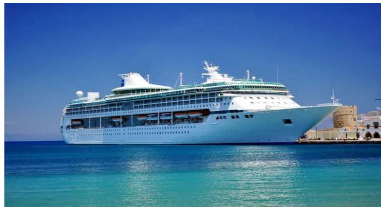
Royalty Free πλοίο