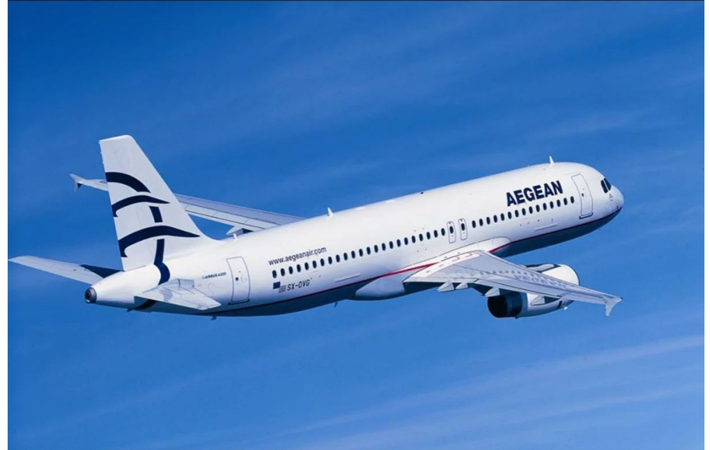
Αεροπλάνο της εταιρείας Aegean

Το ταξίδι με αεροπλάνο είναι ίσως ένας από τους πιο βολικούς τρόπους για να ταξιδέψει κάποιος καθώς με αυτό μπορεί να φτάσει κάποιος παντού και σε σχετικά λιγότερο χρονικό διάστημα από ότι με τα άλλα μέσα μεταφοράς. Όμως πριν γίνει κράτηση εισιτηρίων πρέπει να γίνει έλεγχος των κανονισμών που ισχύουν στη χώρα αναχώρησης και άφιξης και να βεβαιωθεί ο κάθε επιβάτης ότι έχει όλα τα απαραίτητα έγγραφα για το ταξίδι. Ανάλογα τον προορισμό, τα έγγραφα που ενδέχεται να ζητηθούν είναι: Ταυτότητα, Διαβατήριο, Visa. Κατά τη διάρκεια του check-in του αεροδρομίου ζητούνται τα απαραίτητα έγγραφα, ο επιβάτης δίνει την αποσκευή του που δεν μπορεί να έχει μαζί του για να ζυγιστεί, καθώς υπάρχει συγκεκριμένο βάρος που επιτρέπεται να έχει μαζί του και το επιπλέον χρεώνεται, και έπειτα παραλαμβάνει την κάρτα επιβίβασης. Στην συνέχεια περνάει από αυστηρό έλεγχο ασφαλείας και μετά την ολοκλήρωση του θα είναι έτοιμος να προχωρήσει στην κατάλληλη πύλη από την οποία θα επιβιβαστεί. Προτείνεται να βρίσκεται ο κάθε επιβάτης στο αεροδρόμιο τουλάχιστον 2 ώρες πριν την αναχώρηση της πτήσης του.